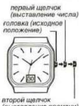
первый щелчок (выставление числа) головка (исходное положение) второй щелчок (выставление времени)