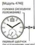
[Модуль 4746] головка (исходное положение) первый щелчок (выставление числа)