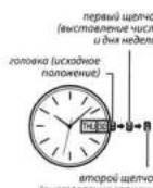
первый щелчок (выставление числа и дня недели) головка (исходное положение) второй щелчок (выставление времени)