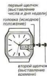
первый щелчок (выставление числа и дня недели) головка (исходное положение) второй щелчок (выставление времени)